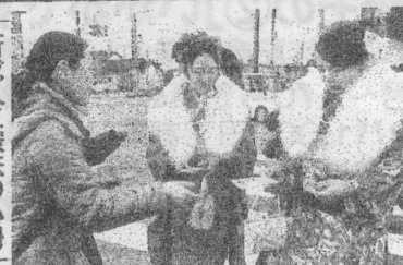
憲法の小冊子 新成人に配布 はらまち九条の会 南相馬市の「はらま