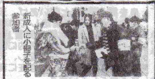
新成人に小冊子を配る 参加者