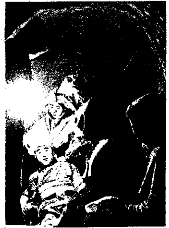
防空壕 空襲のときに避難するため、地を掘って作った穴。