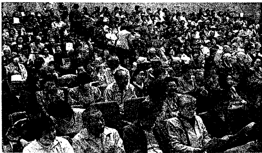
「日本の青空」上映会に詰め掛けた観客 —南相馬市小高区の浮舟文化会館で

日本国憲法起草に大きな影響を与えた憲法学者、鈴木安蔵(1904〜83)を主人公にした映画『日本の青空』がこのほど、鈴木のご郷である南相馬市小高区の浮舟文化会館で一般公開された。「日本の青空」上映南相馬実行委員会主催で、上映会では約350人の観客が集まり、補助