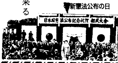
1946年11月3日、宮城前で10万人参加の祝賀総民大会が開かれた。