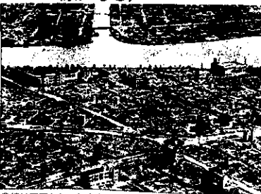
焼け野原となった東京

(1945・昭和20年3月10日未明に行われたアメリカ軍のB29約300機による東京への無差別攻撃のこと。消失家屋26万戸、死者約10万人。特に下町地域は焼け野原になる)