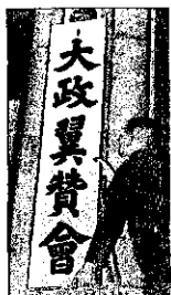
大政翼賛会の発足(1940年10月)

(日中戦争の長期化に伴って、1940年10月、近衛文麿このえふみまるとその側近によって組織された官製の国民統制組織。各政党は解党してこれに参加させられた。総裁は首相、各都道府県支部長には知事が就任した。労働運動や反戦運動などもできない体制が巧妙に作られていった)