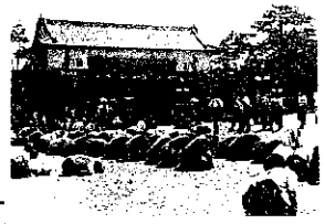
皇居前広場で終戦を迎える人々 8月15日正午から終戦詔勅の玉音放送が流れた。玉砂利にひれ伏して号泣する人々も多かった。