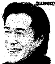
加藤 剛 (高野岩三郎)

1987年、「第一回全日本国民的美少女コンテスト」グランプリ受賞。その後、テレビ、映画、舞台などで、ご活躍です。最近では、井上ひさし原作の舞台「東京裁判三部作 第三部 夢の痲(かさぶた)」に出演。映画「草の乱」、ドラマでは、土曜ワイド劇場、月曜ミステリー劇場など、いわゆる2時間ドラマでおなじみです!!