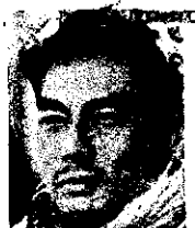
宍戸 開 (白洲次郎)